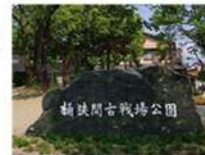
桶狭間古戦場公園

「信長の武運にあやかる、パワースポットと史跡を巡る必勝祈願ルート」として、桶狭間を軸にした観光ルートを紹介。