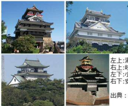
左上:清洲城 右上:岐阜城 左下:小牧山城 右下:安土城

「織田信長公」の歩みを現代において体感できる広域連携の路を確立し、信長公の居城をキーワードとした共同PRなどで、観光振興を図る。