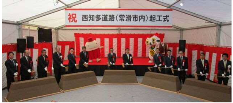
<令和元年12月1日 常滑市内起工式 実施>