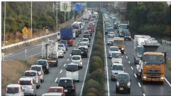
国道 247 号の渋滞状況（東海市内）