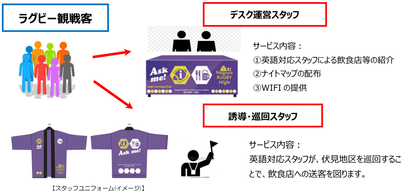
図2：ナイトコンシェルジュデスクイメージ

オリジナル法被を着た英語対応スタッフが、伏見エリアでお楽しみいただける飲食店のご紹介や名古屋の観光案内をします。